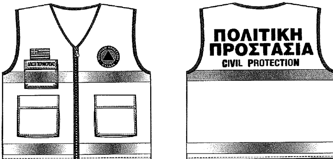
Εικόνα 2. Επιχειρησιακά γιλέκα Πολιτικής Προστασίας

Αναλυτικές προδιαγραφές για την εμφάνιση των επιχειρησιακών μπουφάν και γιλέκων Πολιτικής Προστασίας δίνονται στο 4678/22-11-2004 έγγραφο ΓΓΠΠ.