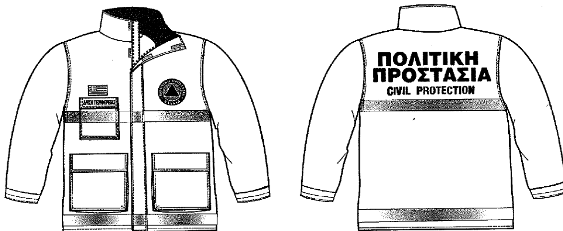
Εικόνα 1. Επιχειρησιακά μπουφάν Πολιτικής Προστασίας

Σύμφωνα με το 4678/22-11-2004 έγγραφο ΓΓΠΠ, τα επιχειρησιακά μπουφάν Πολιτικής Προστασίας θα πρέπει να έχουν την ακόλουθη μορφή: